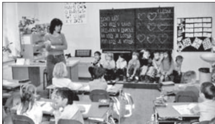
První třídu přišli navštívit předškoláci z Mateřské školy Smetanova, v příštím roce si poslední lednový den své první vysvědčení odnesou i oni.