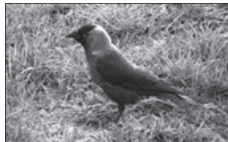
Kavka obecná je silně ohroženým ptačím druhem.

Je nutno zmínit rovněž inteligenci všech krkavovitých a schopnost imitovat nejrůznější zvuky, včetně lidské řeči. V obou vlastnostech vynikají nad papoušky, u nichž je tato vlastnost obecně známa.