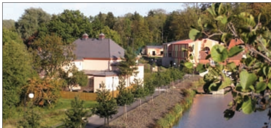
Stav mnoha objektů v tomto místě se za poslední čtyři roky zásadním způsobem změnil, nově opravený Cimrák, kino uvnitř i vně, tělocvična. Nově vyrostl sportovní areál, křižovatka nad kinem, v zemi je nová kanalizace a vodovod, staví se amfiteátr.

Investice v průběhu tohoto volebního období byly nakonec rekordní. Zvládli jsme hned dvě největší stavby v historii města. Výstavba čističky a kanalizačního řadu včetně vodovodů, komunikací a dvou křižovatek nám zajistila splnění přísných podmínek EU. Projekt Centrum Českého Švýcarska I se svými pěti stavbami je ještě větší a vytváří základ infrastruktury našeho města. Řadu dalších staveb bereme už jako samozřejmost. Nebývalé mnoho zajímavých staveb je připraveno anebo se připravuje.