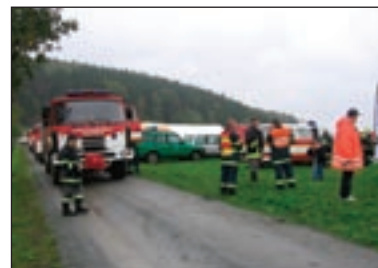
Mezinárodního cvičení se zúčastnily desítky záchrannářů

Rád bych chtěl touto cestou poděkovat všem zúčastněným členům výjezdové jednotky za jejich kvalitní práci při profesionálním zdolávání svěřených úkolů a vzornou reprezentaci krásnolipského Sboru dobrovolných hasičů. Přejme si všichni společně, aby se motiv tohoto cvičení nestal nikdy realitou.