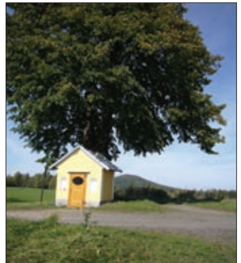
V souvislosti s naučnou stezkou se opravila kaplička a křížek na Sněžné.

Volí se v pátek 20. 10. od 14.00 do 22.00 hodin a v sobotu 21. 10. od 8.00 do 14.00 hodin