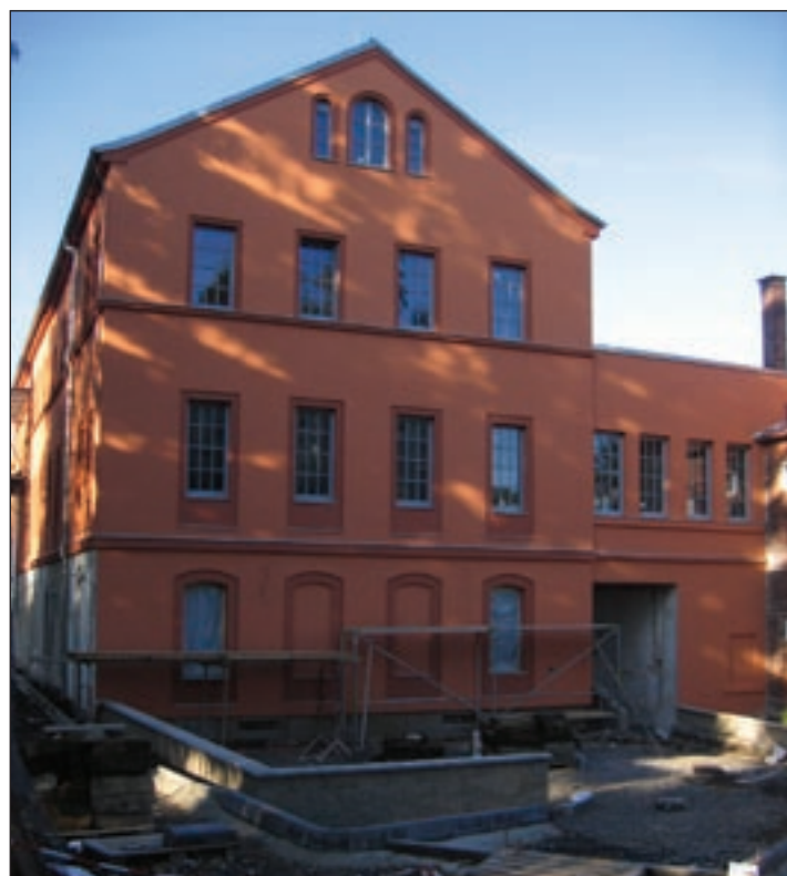
Rekonstrukci továrního objektu (dříve „dům chovatelů“) doprovází i úpravy okolí. Terasa v zadní části bude u cyklostezky směřující až na náměstí.

A investiční projekt Centrum České Švýcarska I? Jak pokračuje?