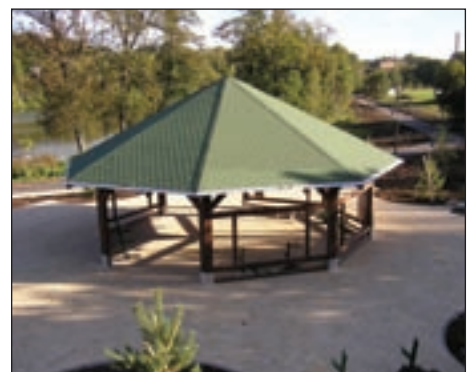
Za Cimrákem při cestě do městského parku bude pěkné odpočinkové místo s altánem