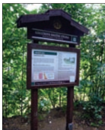
Naučná stezka nás zavede k velmi zajímavým místům.