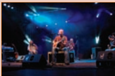
Dny Českého Švýcarska nám přináší zajímavé osobnosti, v roce 2005 to byla mj. přední česká skupina Buty.

Krásná Lípa se v uplynulém volebním období stala hostitelem mnohých uznávaných a známých osobností veřejného života a to nejen z ČR.