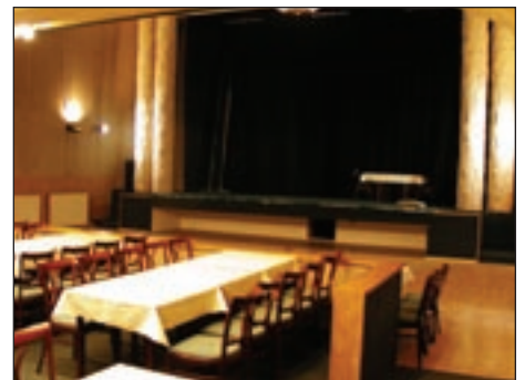
Z kina se stal útulný kulturní dům.