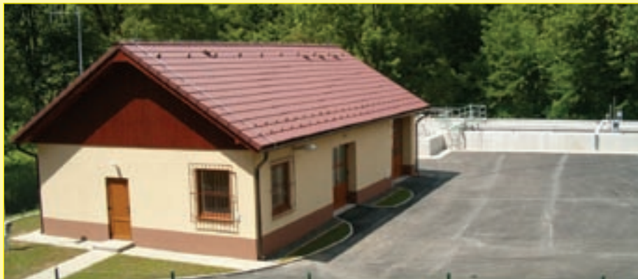
Splnili jsme v předstihu přísné normy EU, v Krásném Buku je nová čistírna odpadních vod, kanalizace, vodovody a navrch nové komunikace jsou ve velké části města.

Projekty, rozpočty a stavební povolení na rozšíření kanalizační řady a vodovodní sítě včetně přípojek jsou již dlouho připraveny. Město nechalo vyprojektovat a vyřídit stavební povolení i na neveřejné, soukromé části přípojek pro všechny dotčené objekty. Stavba je součástí společného projektu osmi obcí na Šluknovsku za tři čtvrtě miliardy korun a dokumentace leží už rok v Bruselu bez jediné odpovědi. Bruselskou administrativu totiž žádný předpis k ničemu nenutí, ani k odpovědi, byť třeba zamítavé. Tento stav však není pro město nevýhodný, neboť si tak alespoň může v příštím roce požádat o dotaci v rámci nového plánovacího období do národních programů. Tam by měla být větší míra podpory – až 85 % - a součástí dotace je i výměna či výstavba vodovodů. „Zatím nechceme v těch předpokládaných ulicích dělat žádné větší opravy komunikací, až do položení sítě. Snad je to vzhledem k nákladům pochopitelné a ještě chvíli to vydržíme,“ doplňuje starosta Linhart. (vik)