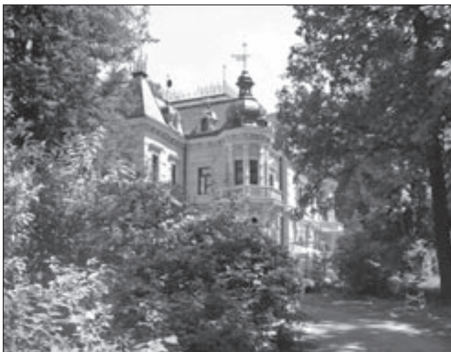
Obnova vnější část Zámečku se blíží do finále, s rekonstrukcí okolního parku se právě začalo.