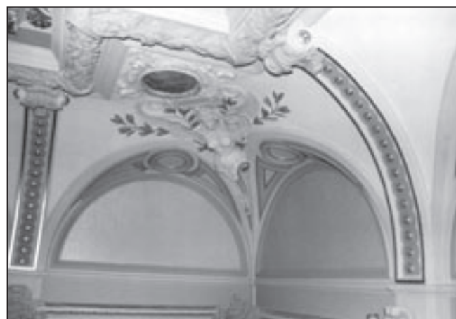
Zdevastované štukové stropy byly plně obnoveny.

Účelem zamýšlené rekonstrukce je šetrná obnova původního kompozičního záměru s akcentem na maximální možné zachování původních vzrostlých dřevin a obnova vnitřní náplně areálu, především vodních ploch a zařízení.