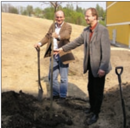
Stromy u nás sázíme ve velkém, někdy pomůže i člen Vlády ČR, zde Petr Gandalovič, jindy Libor Ambrozek či Cyril Svoboda.

„Řekl bych, že o tom to vůbec není. Naopak. Ne-potřebuji, aby mi nějaký spolustraníček radil, kdo by měl získat jakou zakázku a co máme dělat. Znám se s potřebnými politiky napříč politickými stra-