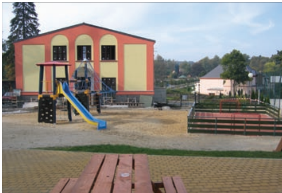
Sportovní areál slouží dospělým i dětem stejně jako kino.