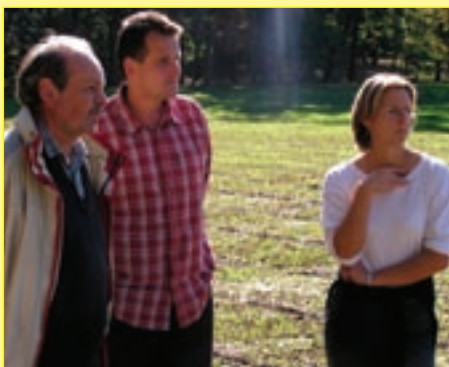
Zkušební komise hodnotí

Napětí a nervozita se daly vyčíst v tomto týdnu z tváří mnoha klientů rekvalifikačních kurzů krásnolipského Komunitního centra Českého Švýcarska (KCČŠ). Pro skupinu 22 klientů nastal čas prvního vážného prověření načerpaných znalostí a dovedností – praktická zkouška.