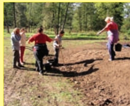
Praktická zkouška - výsev trávníků

To vše jsou činnosti, které jiná města musí platit zpravidla privátním firmám. Dlouholetý