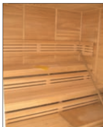
V rekonstruovaném továrním objektu je vedle solária, fitnes, klubovna a masérny již i funkční sauna.

„Obojí je pravda. Česká vláda však domluvila zvláštní podmínky. A pak celou tu administrativu na naší straně ohromně opozdila a zbytečně zkomplikovala. Výsledkem je, že naše republika fakticky do EU více přispívá, než z ní čerpá. To je fakt neuvěřitelné. Naše město má v posledních letech vždy projekty připravené dopředu a naučili jsme se dobře zpracovat veškerou tu náročnou administrativu a přípravu. Proto jsme mezi nejúspěšnějšími v republice. A to nejen pokud jde o investiční projekty. Naše o. p. s. České Švýcarsko má řadu i velkých evropských dotací na cestovní ruch, propagaci a rozvoj. Získali jsme i dotaci ze Světového fondu životního prostředí při OSN. Jako město máme i jeden z největších neinvestičních projektů v rámci Evropského sociálního fondu – Komunitní centrum České Švýcarska.“