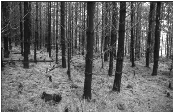
Vejmutovkový les je téměř bez života