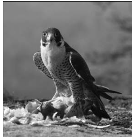
Sokol stěhovavý, vzdušný král a opeřený drahkakom NP České Švýcarsko, s uloveným holubem.