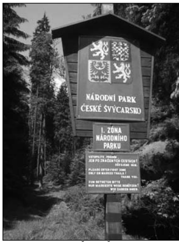
V Národním parku České Švýcarsko je zákaz vstupu mimo značené cesty omezen pouze na I. zónu