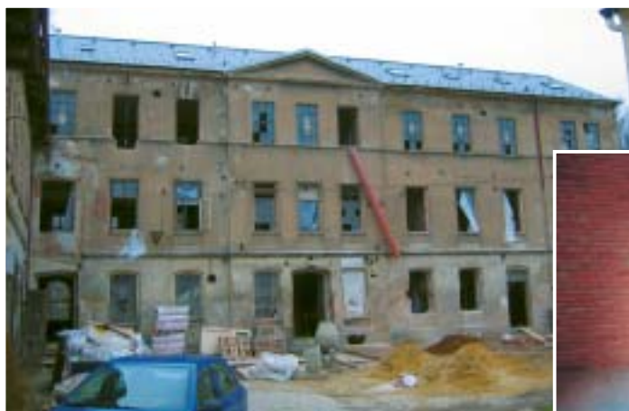
Centrum služeb (bývalý dům chovatelů) má již novou střechu, jsou hotovy všechny bourací práce, vyzdvírají se nové stěny. Na obrázku je budoucí sauna (dole) a klub. →