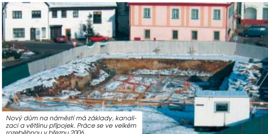
Nový dům na náměstí má základy, kanalizační a většinu přípojek. Práce se ve velkém rozeběhnou v březnu 2006.