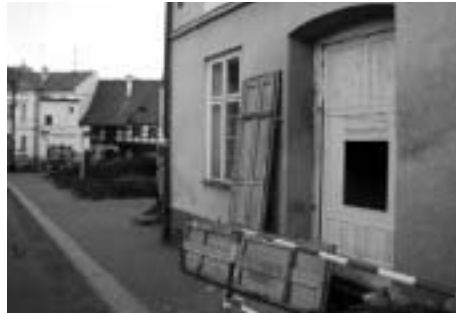
Úpravy před instalací a zprovozněním nového bankomatu na Pražské 3, (zl)