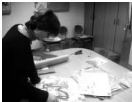
Porota výtvarné soutěže se dala do práce.